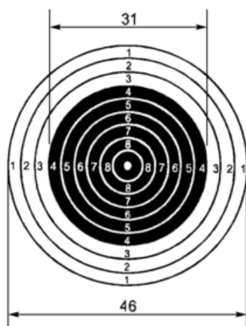
Мишень № 8. Размеры даны в мм

Мишень для выполнения упражнений стрельбы из пневматической винтовки